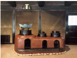
紅殻漆喰で化粧塗りを施した三連かまど