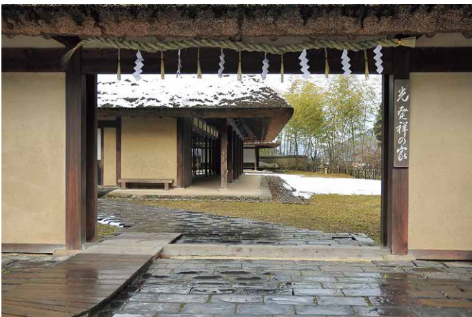
正門表札に記された「光発祥の家」の「光」は真心の意です