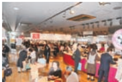
▲巨大レッドカードバナーを掲出した東京霞が関店

本作戦の重大性や緊急性を、広く世の中全体にPRするために、大群衆の集まる巨大な公共の場を自前で作ろうという作戦です。既に左の7店が大盛況営業中で、その大なる目的は、着々と達成されつつあります。詳しいことは、同封の作戦要覧をご精読ください。もはや他人事ではありませんから。