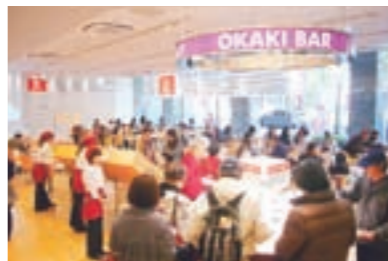
▲同じく大阪御堂筋店